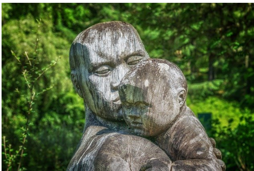
„Trost“ – Bild von Peter H auf Pixabay