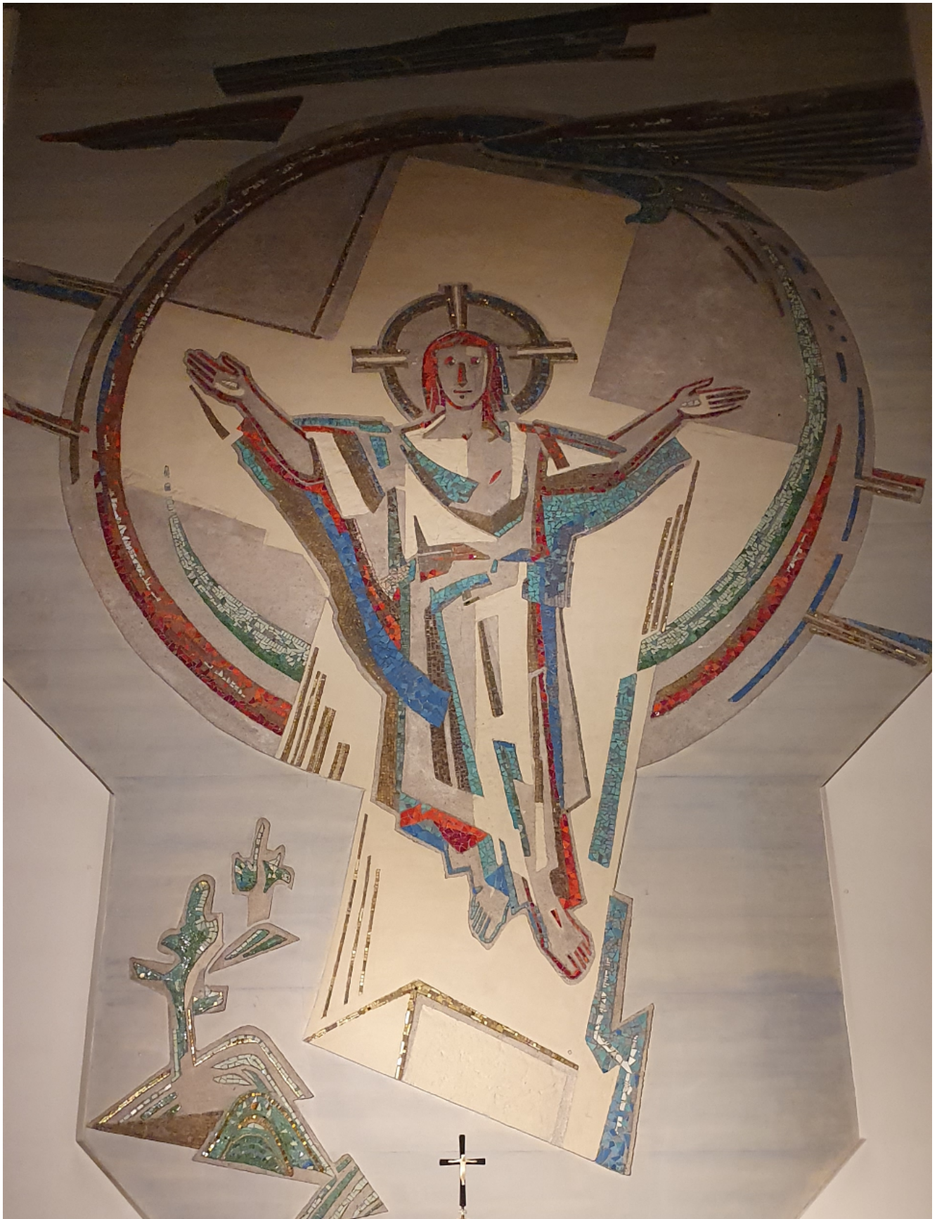
Altarbild in St. Clemens, Oberhausen-Sterkrade, 21.11.2020

meinem Rücken befindet: dieses große Bild hier im Altarraum hinter mir.